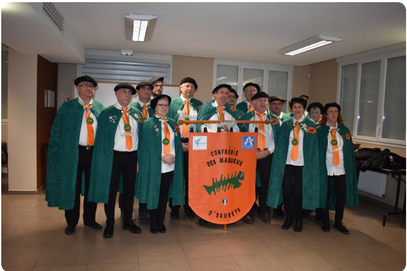
Photo prise à l'assemblée générale du 5 décembre 2018